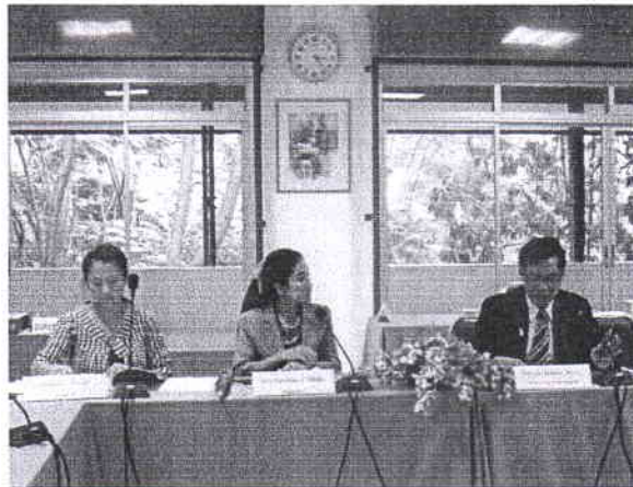
คณะกรรมการสรุปการตรวจประเมินคุณภาพฯ และให้ข้อเสนอแนะในการพัฒนาหน่วยงาน