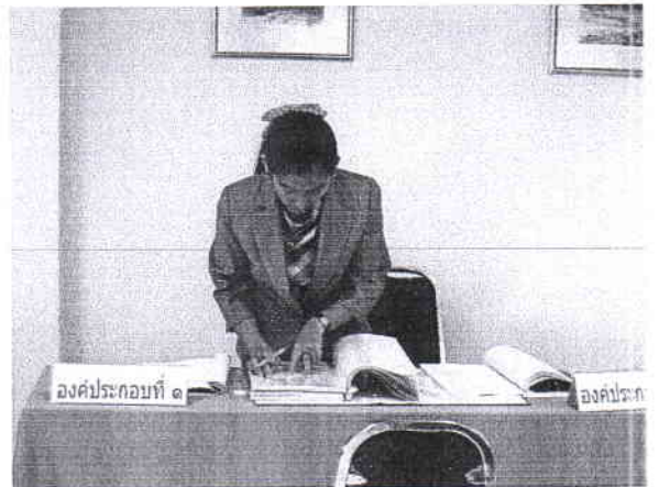
บรรยากาศการตรวจประเมินคุณภาพภายใน สำนักศิลปวัฒนธรรมและพัฒนาชุมชน