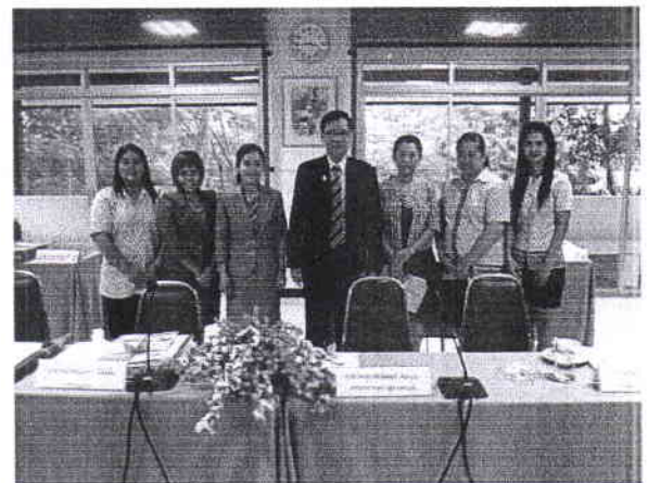
มอบของที่ระลึกและถ่ายรูปร่วมกัน