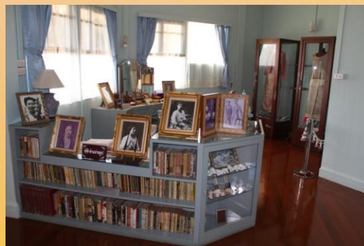
ห้องพระบรรทม