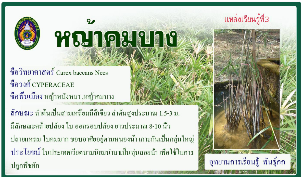
กกหญ้าใบคม