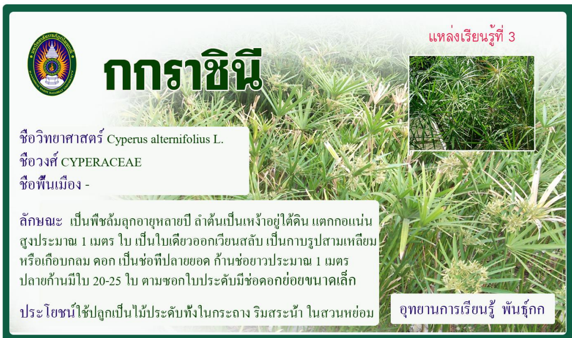
กกกราชนี