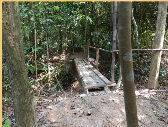
สะพานข้ามร่องน้ำ