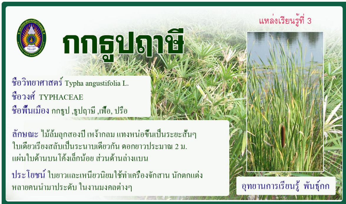
กกธูปฤาษี