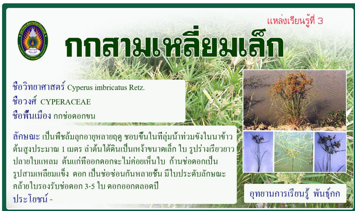
กกสามเหลี่ยมเล็ก