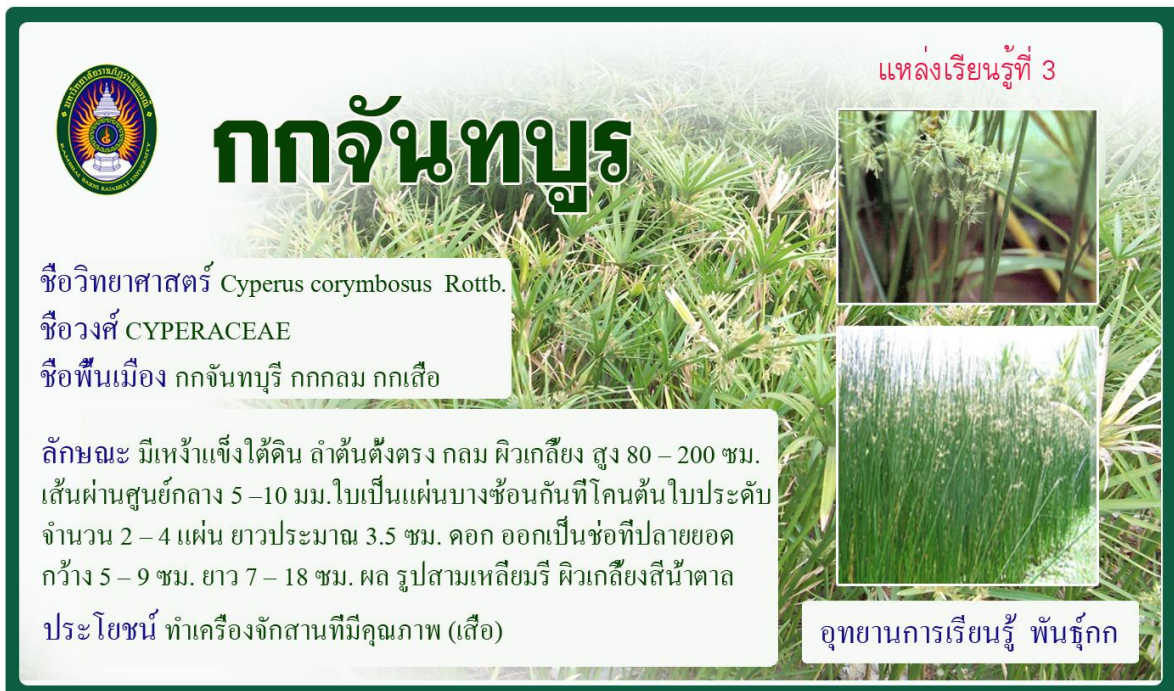
กกจันทบูร