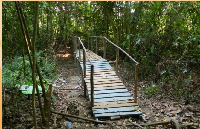
สะพานข้ามร่องน้ำ

เนื่องจากต้นไม้เป็นหัวใจหลักของป่า หากไม่มีต้นไม้ก็จะมีน้ำ ไม่มีสัตว์ ฝนจะไม่ตก หรือหากฝนตก น้ำก็จะท่วมเนื่องจากไม่มีพืชมาดูดซับน้ำไว้ ประโยชน์และความสำคัญของต้นไม้จึงจำเป็นอย่างยิ่งที่จะต้องมีการส่งเสริมการให้ความรู้ กับเยาวชน ประชาชน ที่จะต้องมีจิตสำนึกในการอนุรักษ์และหวงแหนป่า