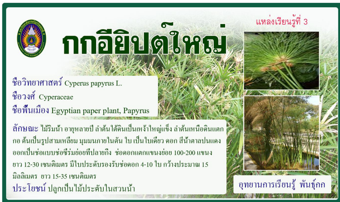
กกอียิปต์ใหญ่