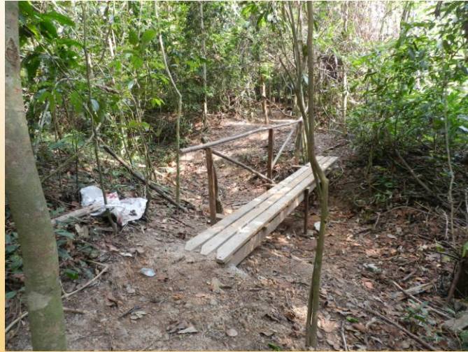
สะพานข้ามร่องน้ำ