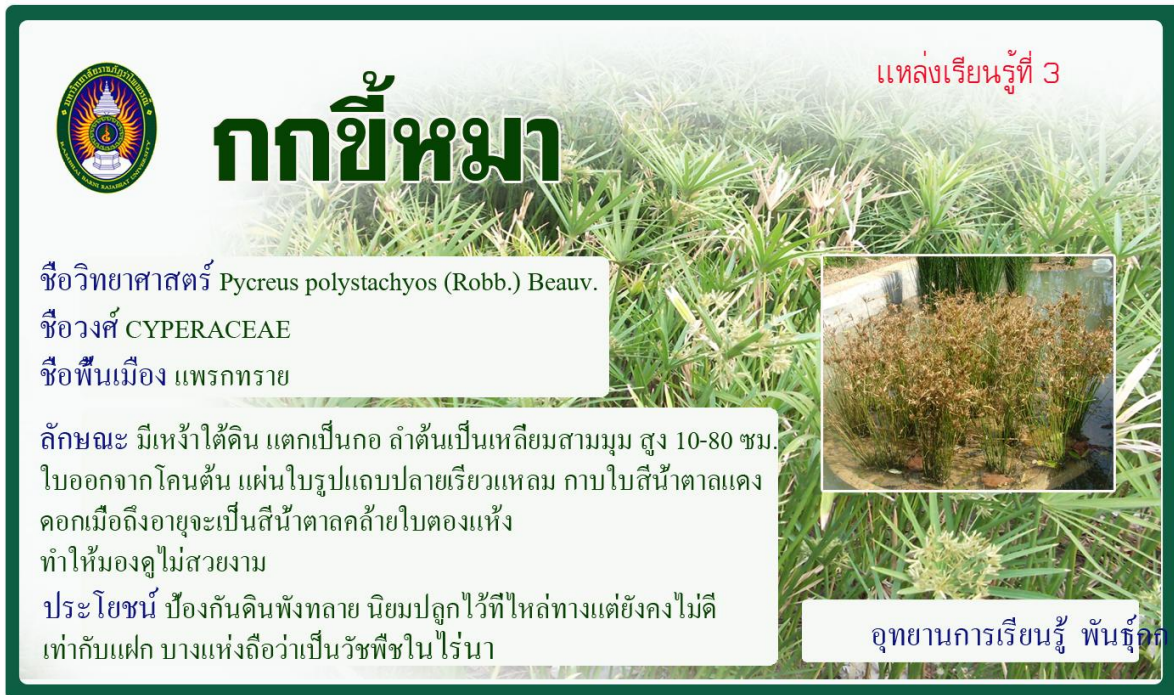
กกขี้หมา