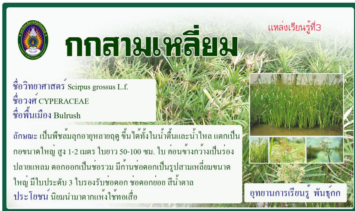
กกสามเหลี่ยม