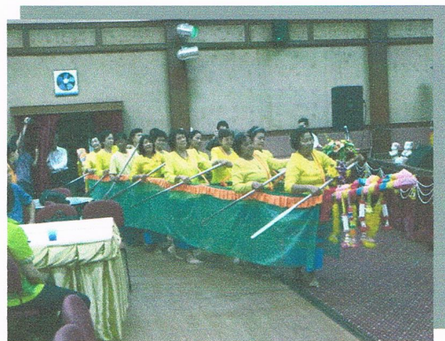
เข้าร่วมฟังการบรรยายท่องเที่ยวเชิงบูรณาการ งานวัฒนธรรม