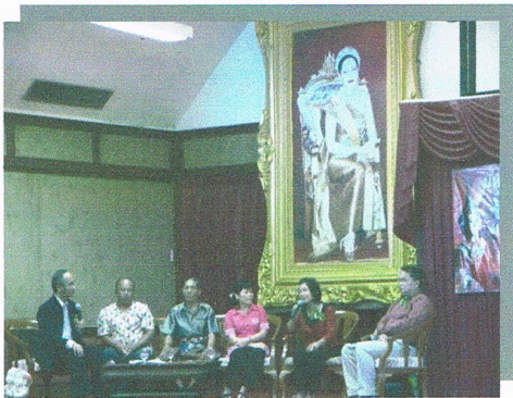
การเสวนาวัฒนธรรมพื้นบ้านแต่ละของท้องถิ่น

เมื่อวันที่ ๕-๖ สิงหาคม ๒๕๕๓ สำนักศิลปวัฒนธรรมและพัฒนาชุมชนเข้าร่วมงานมหกรรมศิลปวัฒนธรรมพื้นบ้านระดับชาติ ครั้งที่ ๑ “ ราชภัฏสืบสานตำนานศิลป์ ” จัดโดยสถาบันวิจัยและส่งเสริมวัฒนธรรม ณ หอประชุมภูมิแผ่นดิน มหาวิทยาลัยราชภัฏเพชรบุรี โดยมีวัตถุประสงค์เพื่อสืบสานงานศิลปวัฒนธรรมพื้นบ้านให้คงสืบต่อไป ทั้งนี้มีการจัดนิทรรศการการเสวนาทางด้านวัฒนธรรม โดยมีมหาวิทยาลัยราชภัฏ ๕ แห่ง เพชรบุรี กาญจนบุรี เทพสตรี ราชนครินทร์ รวมทั้งสถาบันวัฒนธรรมศึกษากัลยาณิวัฒนา มหาวิทยาลัยสงขลานครินทร์ เข้าร่วมการเสวนาพร้อมทั้งการแสดงทางวัฒนธรรมพื้นบ้านแต่ละของท้องถิ่น